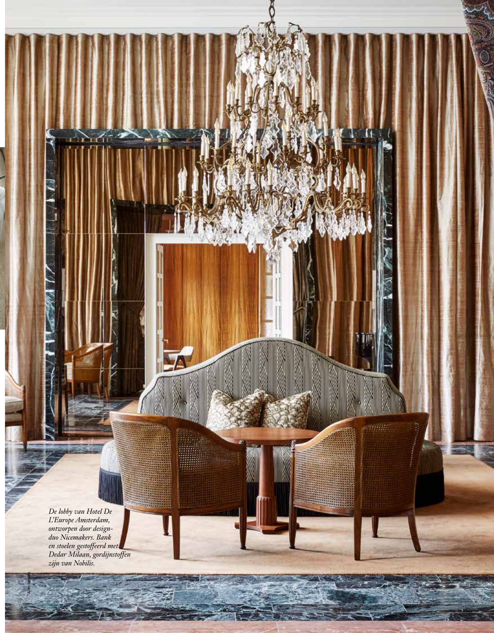
De lobby van Hotel De L'Europe Amsterdam, ontworpen door design-duo Nicemakers. Bank en stoelen gestoffeerd met Dedar Milaan, gordijnstoffen zijn van Nobilis.