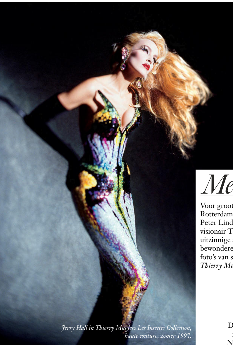
Jerry Hall in Thierry Muglers Les Insectes Collection, haute couture, zomer 1997.